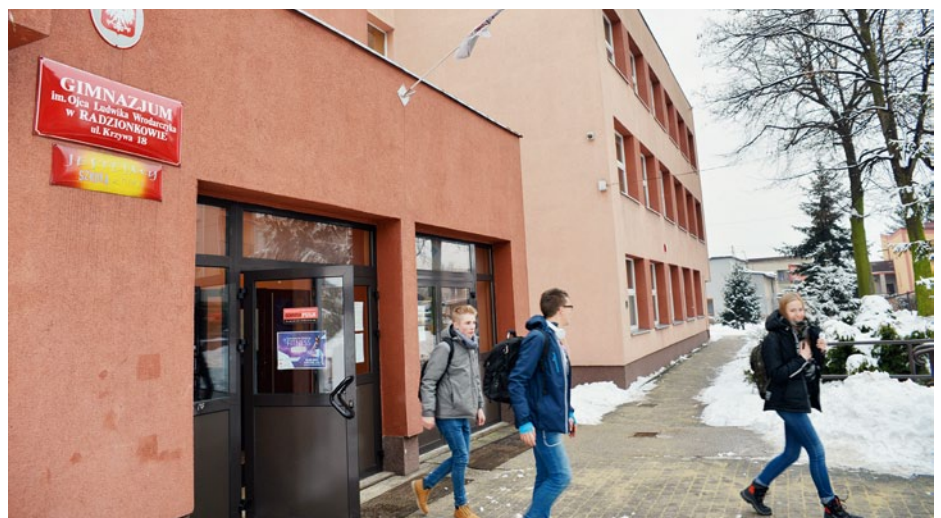
Gimnazjum im. Ojca Ludwika Wrodarczyka zostanie włączone do Szkoły Podstawowej nr 1

Zgodnie z przyjętą koncepcją, Gimnazjum im. Ojca Ludwika Wrodarczyka zostanie włączone do Szkoły Podstawowej nr 1, która jako ośmioletnia będzie funkcjonować w dwóch siedzibach. W dotychczasowej obowiązek szkolny będą realizowali uczniowie klas I-IV,