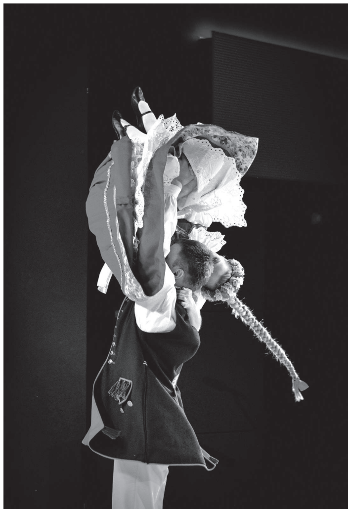
Kategoria „Reportaż lub zdjęcie reporterskie”, III miejsce, autor Łukasz Ungier