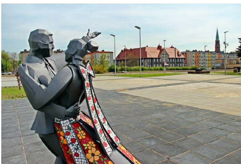
Płytę rynku zdobią nowoczesne rzeźby

Po dwóch latach intensywnych prac, związanych z rewitalizacją terenu po byłym pegeerze przy ul. Knosały, mieszkańcy korzystają już z eko-ryнку.