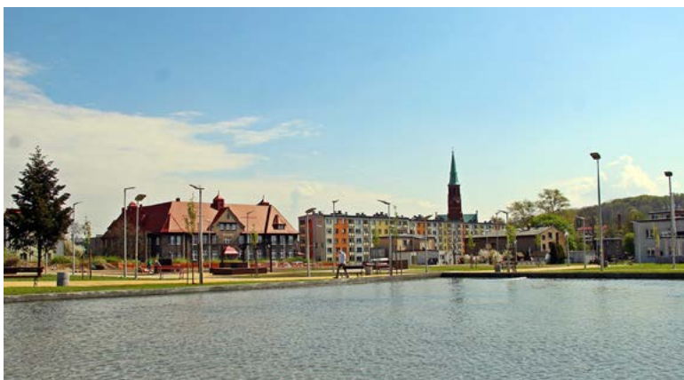
Rynek – nowe miejsce wypoczynku mieszkańców